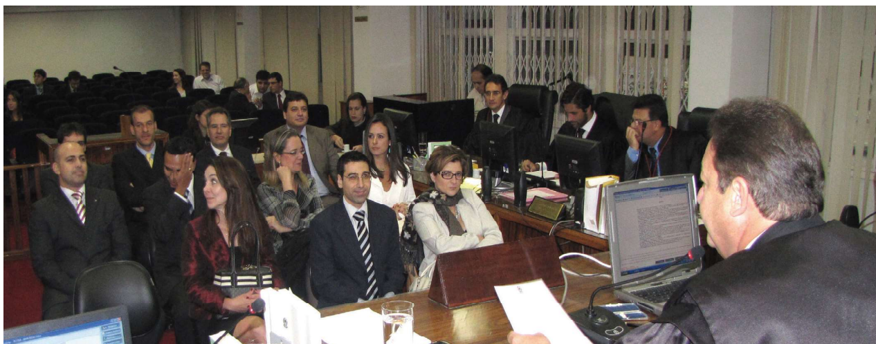
Juízes eleitorais, que vão comandar as próximas eleições municipais, são empossados

O presidente do TRE-RJ, desembargador Luiz Zveiter, deu posse a 13 juízes eleitorais na seção plenária do dia 14 de junho. Em breves palavras, o presidente saudou os empossados e desejou-lhes sorte. “Os juízes eleitorais terão um pleito bem difícil pela frente, de bastante responsabilidade, por se tratar de uma eleição municipal. O Tribunal, no entanto, vai dar todo o suporte necessário aos Juízos Eleitorais”, garantiu o desembargador, ao parabenizar os recém-empossados. “O mérito é dos senhores, que conseguiram transformar o TJRJ no melhor tribunal deste país e com certeza irão fazer a mesma coisa nesta justiça especializada”, concluiu Zveiter.